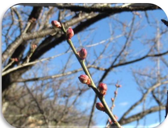
烈公梅(れっこうばい)