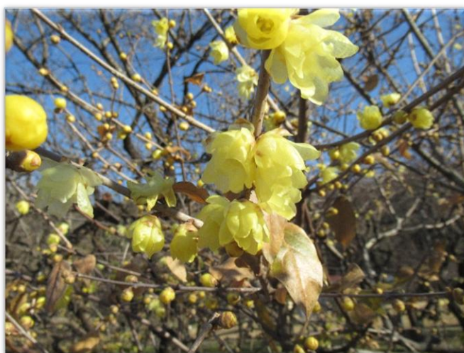
素心蠟梅(そしんろうばい) ロウバイ科