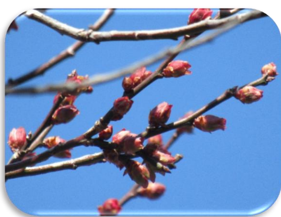
寒紅梅(かんこうばい)