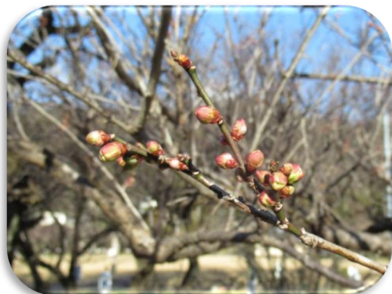
早咲鶯宿(はやざきおうしゅく)