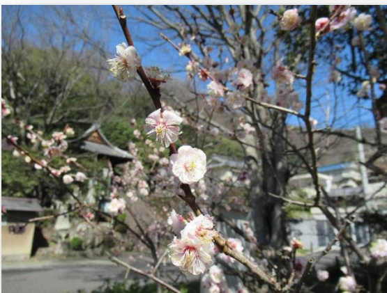
八重寒紅(やえかんこう)