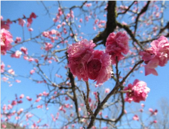
御所紅(ごしょべい)