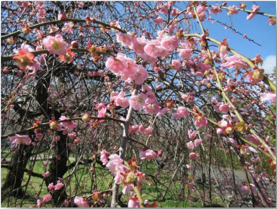
枝垂れ梅(しだれうめ)