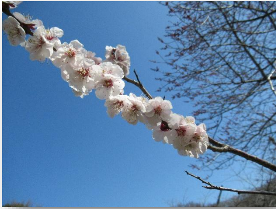
豊後鶯宿(ぶんごおうしゆく)