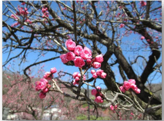
蝶の羽重ね(ちょうのはがさね)