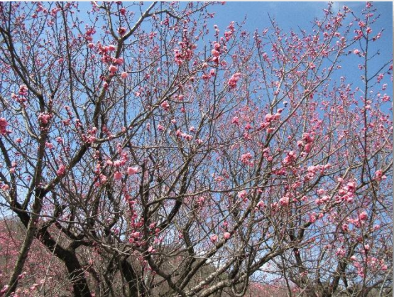
御所紅(ごしよべに)