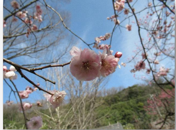
桜鏡(さくらかがみ)