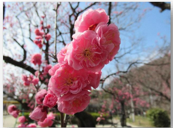
蝶の羽重ね(ちょうのはがさね)