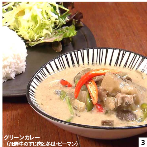
グリーンカレー (飛騨牛のすじ肉と冬瓜・ピーマン)