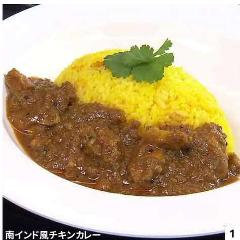
南インド風チキンカレー