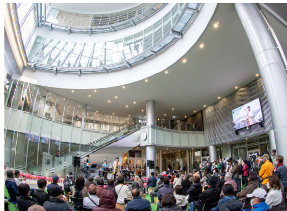
柳ヶ瀬グラスル35 Gテラス