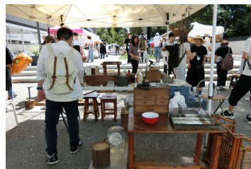
■GIFU ANTIQUE ARCADE 毎月第4日曜に開催される古道具店やアンティークショップが出店するマーケット。9/24は金公園で開催。