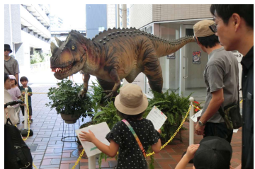
■ジュラシックアーケード(9/23-24) 商店街の中に巨大恐竜が全9体。恐竜クイズラリー、恐竜絵画作品展、各店舗でも恐竜コラボサービスを実施。