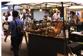
■サンデービルディングマーケット 毎月第3日曜と偶数月の第1日曜に開催されるライフスタイルマーケット。8/6はナイトマーケットを開催。