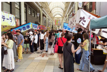
■ぎふ柳ヶ瀬夏まつり (8/11) 柳ヶ瀬通一丁目会場では、野外プロレス等のステージイベント、お化け屋敷、柳ヶ瀬露天横丁などを開催。