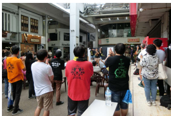
■日ノ出町より元気を発信! 毎月第2日曜に、日ノ出町どまん中広場で開催。アイドルグループやマジシャンなどのステージイベントを開催。