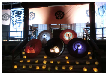
■神田町孝行花火の宵 (8/20) 先行があるなら後行も、と花火大会に感謝するイベントを開催。長良橋通りのブースで線香花火を楽しみました。