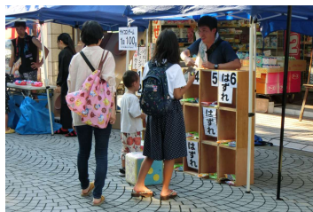
■美殿町ガス灯夏祭 (8/12) キッチンカーや美殿町の飲食店による美味しいもの屋台が並びました。子ども向けゲームやビンゴ大会も開催。