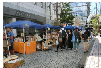
■みとのブックフリマ (9/17) 読み終えた本や自主制作冊子を販売する本限定のフリマ。歩行者天国にした通りでオープンカフェ&バルも開催。