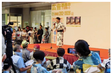
■ぎふ柳ヶ瀬夏まつり (8/11) 高島屋前わくわく広場会場では、ゆかたレンタル、ゆかたコンテスト、伝統芸能のステージイベント等を開催。