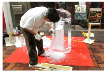
■劇北&レンガ通り☆夏まつり(8/6) 岐阜・愛知の菓子職人や調理師が参加した氷の彫刻展コンテスト。猛暑の中、1時間で作品を仕上げました。