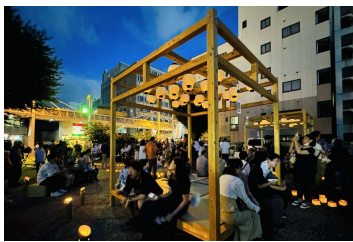
■神田町先行花火の宵 (8/5) 4年ぶりの長良川の花火大会に先行して、神田町商店街が企画。円徳寺の会場で線香花火のイベントを開催。