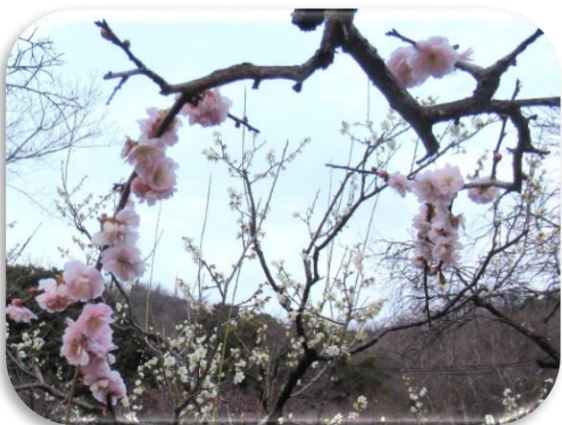
玉垣枝垂(たまがきしだれ)