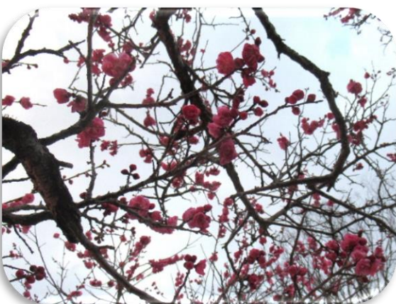
御所紅(ごしよべに)