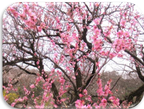
一重寒紅(ひとえかんこう)