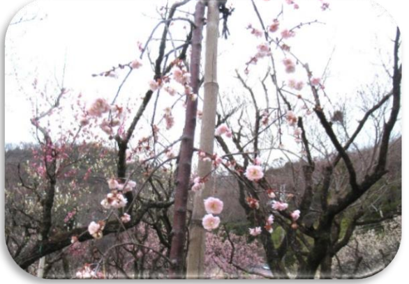
藤牡丹枝垂(ふじぼたんしだれ)