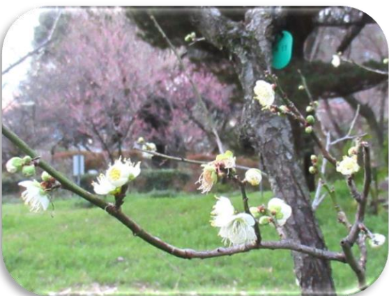
月の桂(つきのかつら)