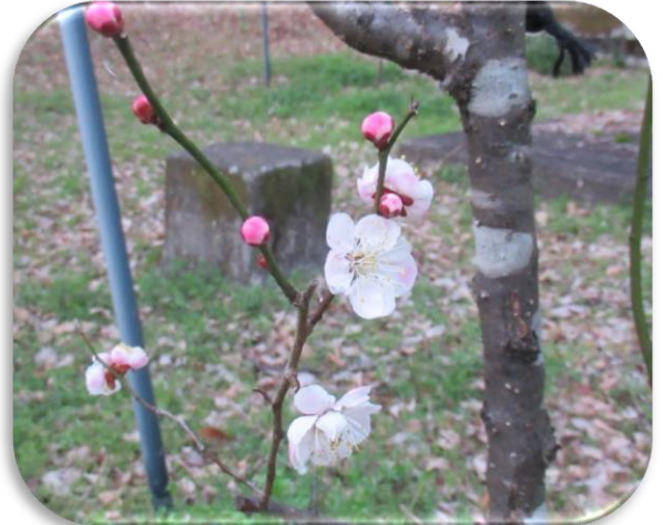
八重揚羽(やえあげは)