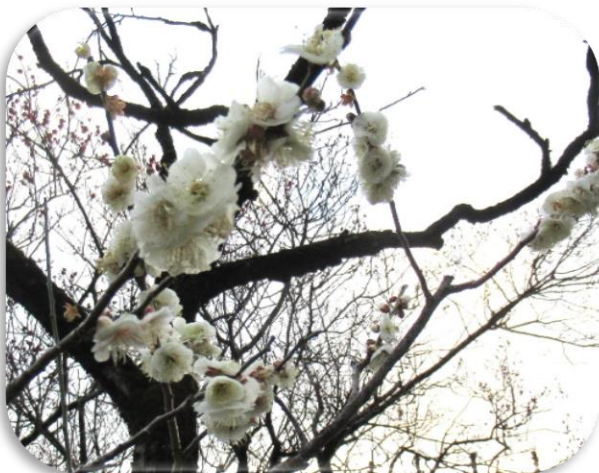
八重野梅(やえやばい)