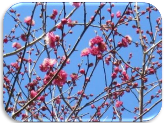
寒紅梅(かんこうばい)