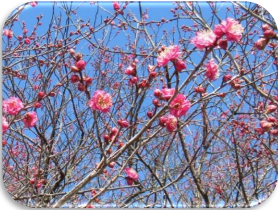
烈公梅(れっこうばい)