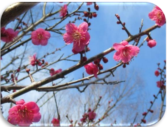
大盃(おおさかずき)