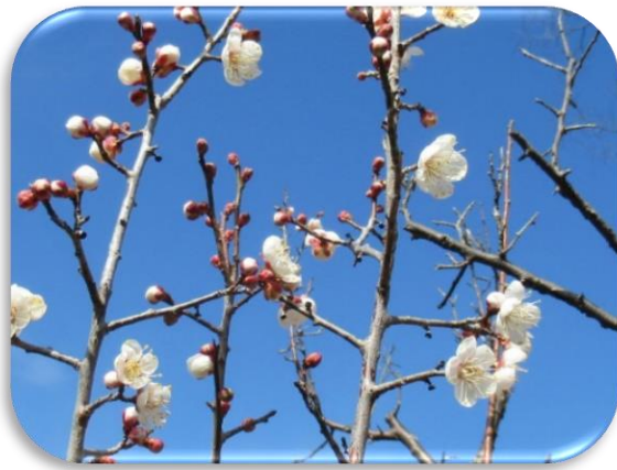
紅鶯宿(べにおうしゆく)