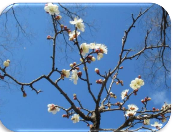
冬至梅(とうじばい)