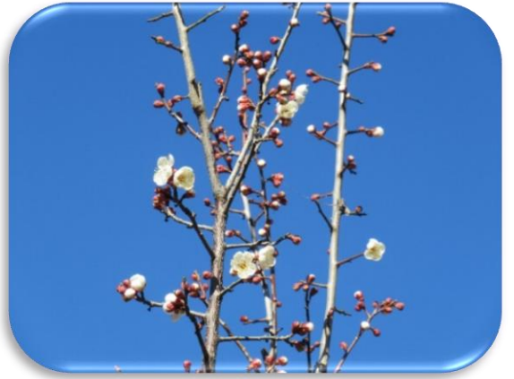
早咲鶯宿(はやざきおうしゆく)