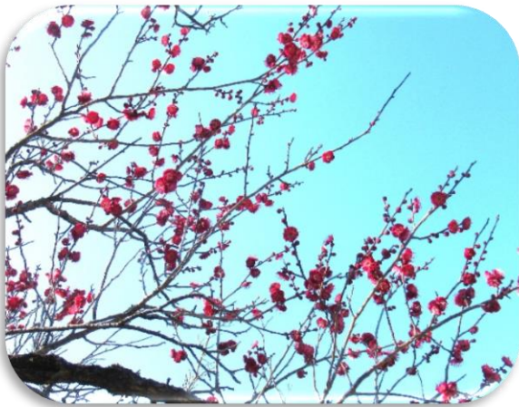
鹿児島紅(かごしまこう)