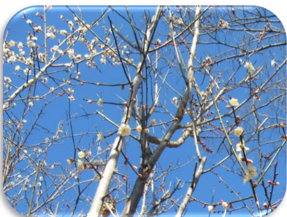
甲州小梅(こうしゅうこうめ)