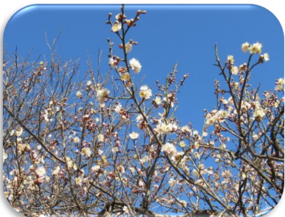
紅冬至(べにとうじ)