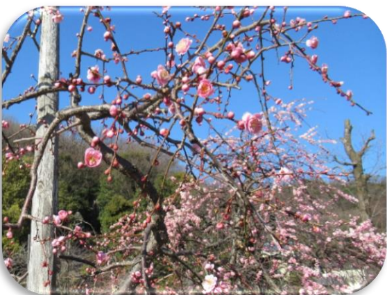
呉羽枝垂(くれはしだれ)