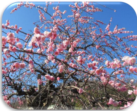
枝垂れ梅(しだれうめ)