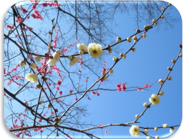
八重茶青(やえちゃせい)