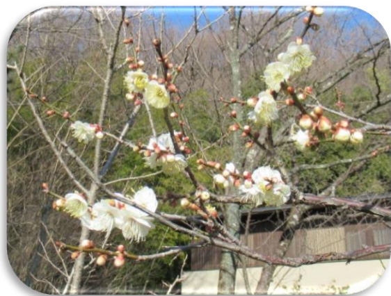
叡山白(えいざんぱく)