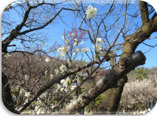
蝶の羽重(ちょうのはがさね)