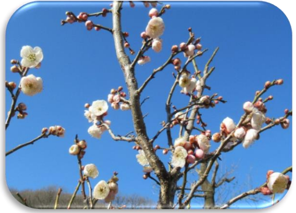
都錦(みやこにしき)