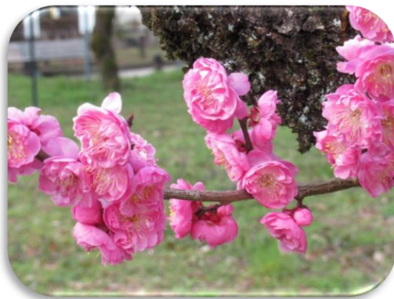
御所紅(ごしよべに)