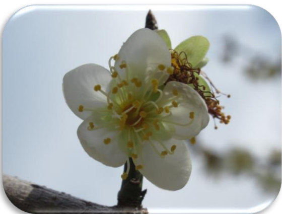
青軸梅(あおじくうめ)