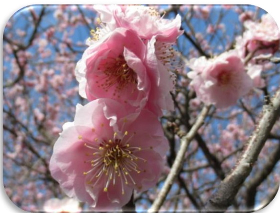
桜鏡(さくらかがみ)