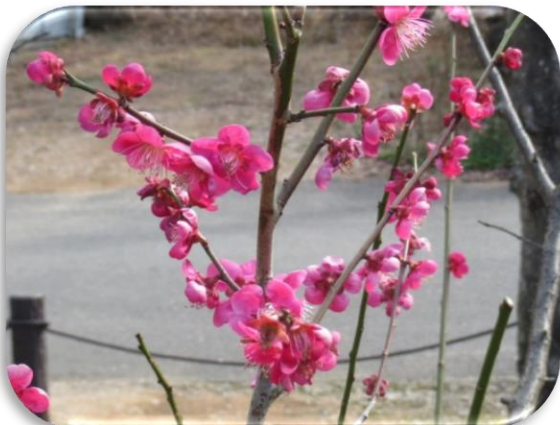
紅千鳥(べにちどり)