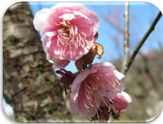
幾夜寝覚(いくよねざめ)